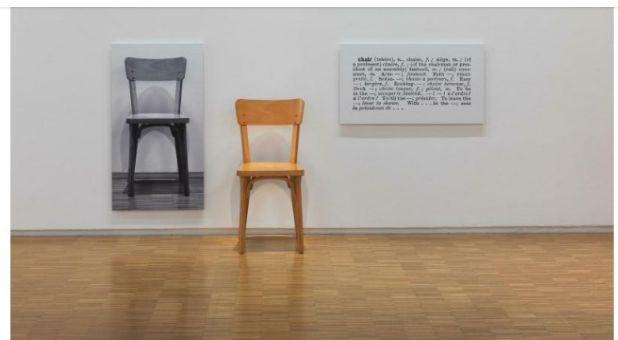
Joseph Kosuth, One and Three Chairs (Une et trois chaises, Installation, bois, tirages photographiques, Centre Pompidou, Paris,)