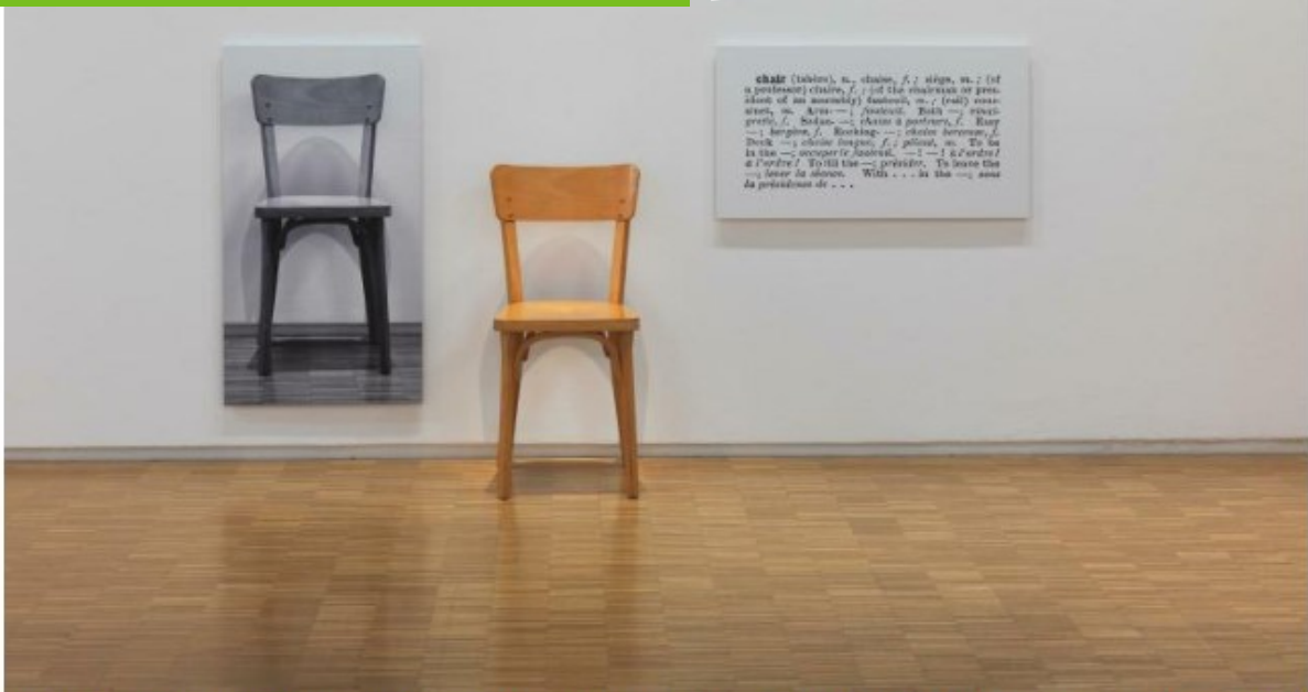
Joseph Kosuth, One and Three Chairs (Une et trois chaises, Installation, bois, tirages photographiques, Centre Pompidou, Paris

Veillez sélectionner une des adresses proposées lors de la saisie pour que les champs latitudes et longitude se complètent automatiquement :