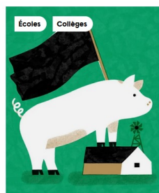
Écoles Collèges 8 avr. - 11 avr. 2025 La Ferme des animaux