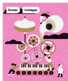
Écoles Collèges 24 mars - 25 mars 2025 L'Avenir nous le dira