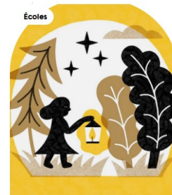
Écoles 23 mai - 27 mai 2025 Rosa Lune