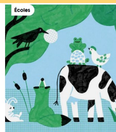
Écoles 9 déc. 2024 - 11 avr. 2025 Les Premières notes

https://www.opera-lyon.com/espace-enseignants/ecoles-et-colleges?