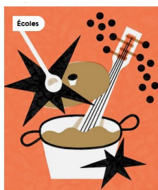
Écoles 11 févr. - 14 févr. 2025 La Cuisine Musicale